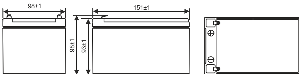
F2 (FASTON TAB 250)